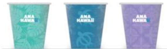
Tazze FLYING HONU