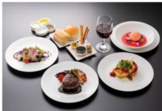
Menù in First Class

ANA collaborerà anche con il ristorante australiano bills alla creazione della proposta gastronomica per i passeggeri di classe economica in partenza dal Giappone. Questo menù sarà servito dal 24 maggio 2019 fino alla fine di maggio 2020. I passeggeri riceveranno inoltre un coupon speciale per un drink omaggio presso il ristorante bills di Waikiki.