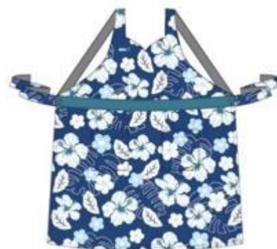
Grembiule FLYING HONU

Per garantire che a bordo dell'A380 ci si senta come a casa, ANA ha prestato particolare attenzione alla biancheria da letto. In prima classe i passeggeri potranno avvolgersi nei piumini del famoso brand Tokyo Nishikawa Sangyo e posare la testa su soffici cuscini di piuma di anatra bianca ungherese. Riceveranno inoltre un pigiama in cotone biologico al 100% e una coperta realizzata dal famoso produttore Tenerita, l'unica azienda giapponese ad aver ottenuto la certificazione Global Organic Textile Standard .