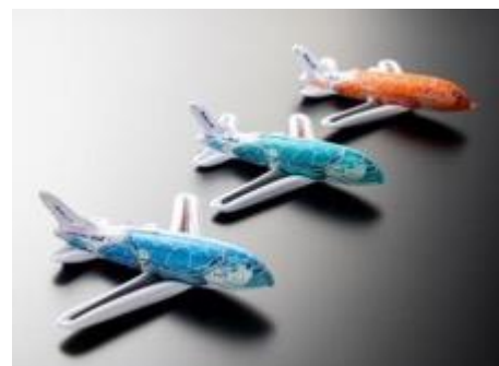
Gonfiabili FLYING HONU