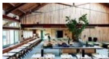
bills di Waikiki