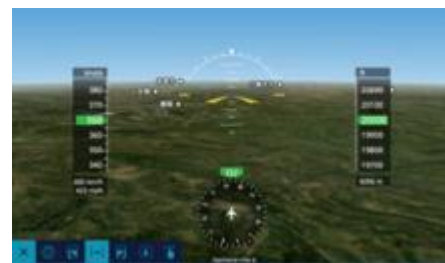
ANA Flight Path 3D

Per festeggiare il nuovo aeromobile, da maggio 2019 ANA metterà in vendita nel duty-free internazionale modellini degli aeromobili e il peluche HONU (Lani) sarà disponibile per l'acquisto su FLYING HONU.