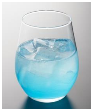
Cocktail Blue Hawaii

Tutte le altre bevande a bordo saranno servite in tazze a tema FLYING HONU, da assistenti di volo che indosseranno grembiuli con design coordinato.