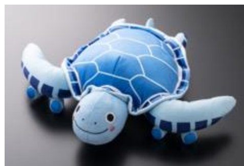
Peluche HONU (Lani) Scala 1/500: circa 14.6 x 16.3 x 5 cm