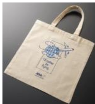
Borse originali ANA