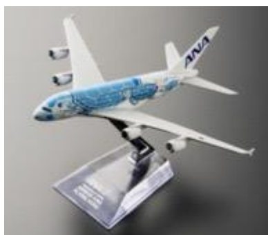
Modellino Airbus A380 FLYING HONU Scala 1/500: circa 14.6 x 16.3 x 5 cm

Per festeggiare il nuovo aeromobile, da maggio 2019 ANA metterà in vendita nel duty-free internazionale modellini degli aeromobili e il peluche HONU (Lani) sarà disponibile per l'acquisto su FLYING HONU.