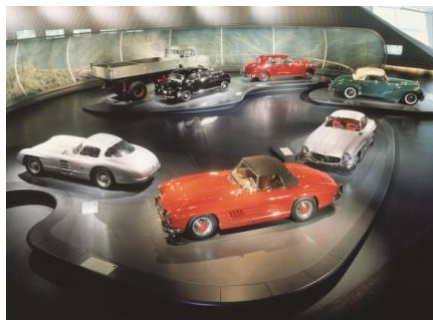
Immagine: Museo Mercedes-Benz, modelli Mythos 4

Forse non tutti sanno che Stoccarda è una città di inventori. Qui sono nati il trapano elettrico e la sega Stihl portatili, la prima idropulitrice europea ad acqua calda e il primo reggiseno, e ancora oggi a Stoccarda viene registrato un numero incredibilmente alto di brevetti – la città si posiziona al secondo posto in Germania e al quarto su scala europea. Ma l'invenzione più famosa di tutte e che da allora ha segnato l'identità della città è stata quella del primo motore leggero veloce e universale da parte di Gottlieb Daimler, nel 1883. Da allora, insieme all'amico e collega Maybach, Gottlieb Daimler darà vita alla motocicletta ( Reitrad ), alla carrozza a motore ( Motorkutsche ) e a molte altre invenzioni. La straordinaria avventura dell'automobile si può oggi ripercorrere al museo Mercedes-Benz – dell'azienda nata dalla fusione della Daimler Motoren Gesellschaft e della Benz & Cie. In un edificio concepito a spirale e su nove piani, il museo ripercorre la storia dell'auto dalle origini ad oggi - e quella del marchio, con alcuni straordinari modelli, come la Papamobile e la SL rossa della principessa Diana ormai entrati nella leggenda, ed è una tappa imprescindibile per chi vuole saperne di più sull'evoluzione della mobilità sulle quattro ruote ( https://www.mercedes-benz.com/en/mercedes-benz/classic/museum/ ).